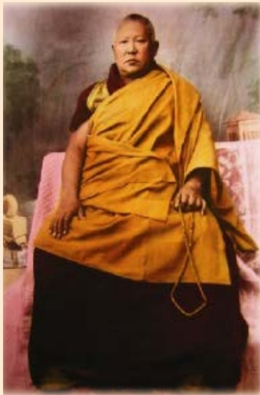
མངོན་པ་སོ། རྗེ་དབྱི་ས་ཞབས་སྤང་ཆེན་མོ་དགོན་མཚོག་སློ་གྲོས་རྒྱ་མཚོ།